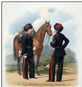
Парадная и праздничная форма Сибирского и Семиреченского казачьих войск. 1867 год